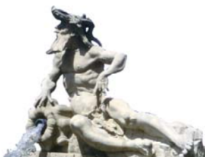
Kommentator: Moenus, der Maingott

Das LANDSCHAFTSBÜRO wurde unterstützt durch weitere Fachleute: WWA Schweinfurt, Pro Natur, Lektor, Sprecher, Tonstudio, Illustrator etc..